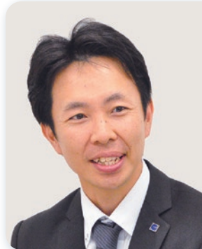
因幡電機産業株式会社 管理本部 情報システム部 システム企画課 主事