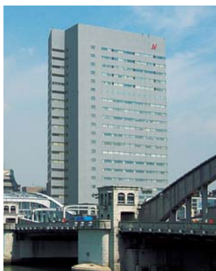
株式会社ニチレイ

1942年に公布された水産統制令に基づき、海洋漁業に伴う水産物の販売、製氷・冷蔵業などの中央統制機関として水産会社を中心に18社が出資、設立した帝国水産統制株式会社が前身。1945年に水産統制令廃止を受けて日本冷蔵株式会社へと改組、1985年には現社名の株式会社ニチレイに商号変更する。2005年には持株会社体制に移行。冷凍食品事業、水産・畜産事業、低温物流事業を中心に、食を中心とした事業領域を幅広く展開。「おいしさ」と「新鮮」をネットワークする。"をブランドステートメントとし、品質にこだわった新鮮で健康的な商品やサービスを提供している。