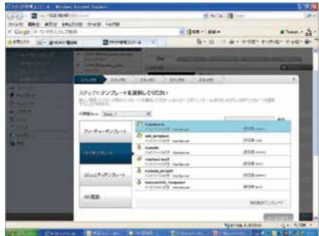
● 数画面の遷移でプロビジョニング可能