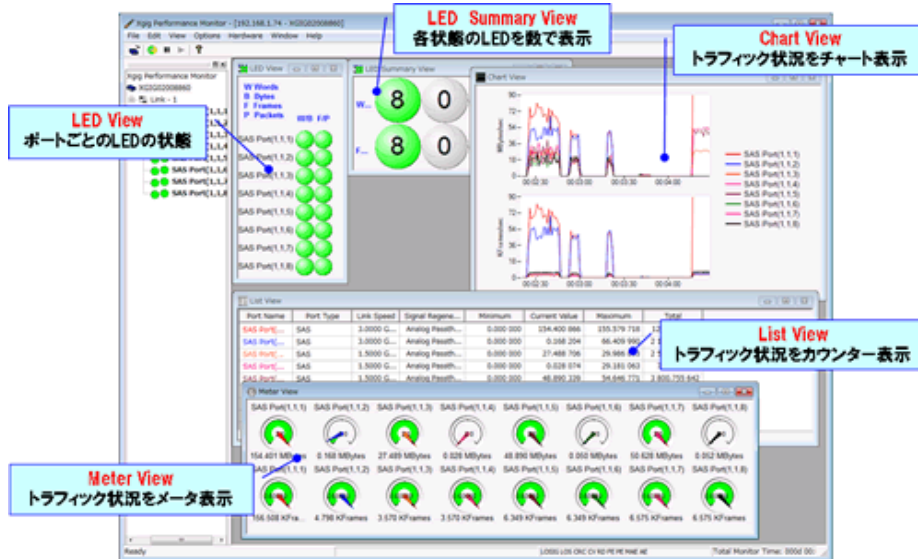
<Performance Monitor 画面>